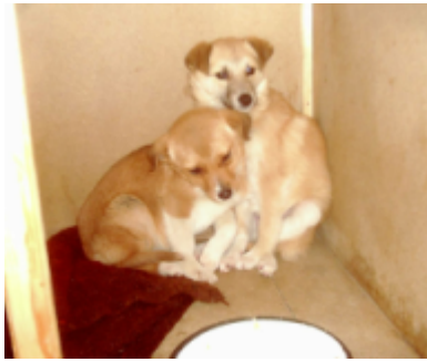
Zwei von den vier Welpen aus Rouse