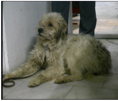
Bobby aus Rouse in Dobrich