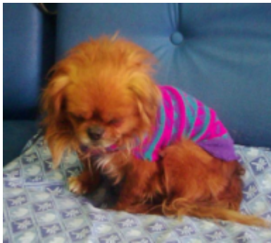
Richi im TH Dobrich