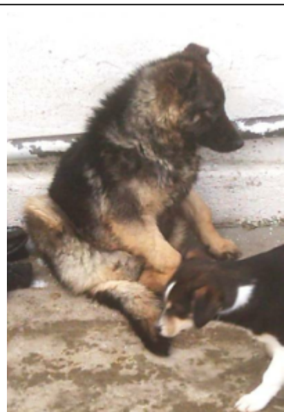
Benny, unser dreibeiniges tapferes Hundeschicksal