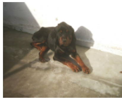
Rocko im TH Dobrich auf dem Weg der Genesung