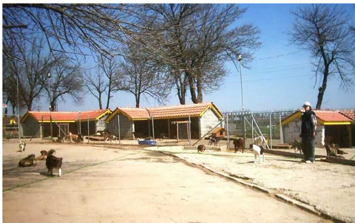
Die neuen Ausläufe mit Unterständen in Schumen.