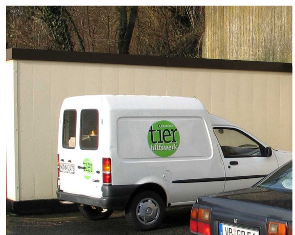
Veränderungen in Dobrich – die neuen Unterstände.